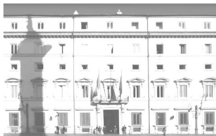
Governo - Ministero della Giustizia

Il Consiglio dei Ministri , venerdì 12 maggio 2017, ha approvato, in esame preliminare, tre decreti legislativi di attuazione della legge delega per la riforma del Terzo settore, dell'impresa sociale e per la disciplina del servizio civile universale (legge 6 giugno 2016, n. 106).