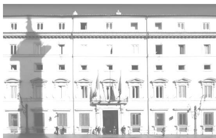
Governo - Ministero della Giustizia

Il Consiglio dei Ministri si è riunito lunedì 10 luglio 2017 alle ore 18.30 e, tra l'altro, ha approvato i seguenti provvedimenti: